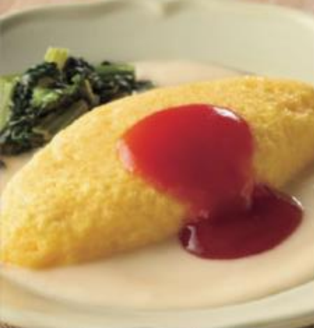
クリームソースオムレツ 商品番号 0245 518円(税込)