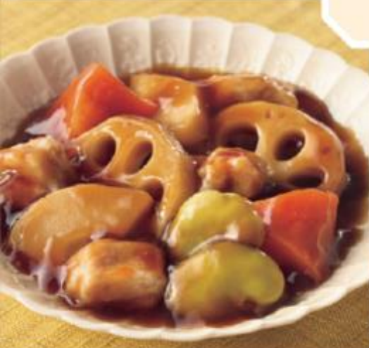
酢豚風黒酢あんかけ 商品番号 0247 648円(税込)