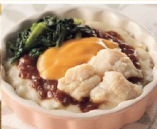
チキンドリア 商品番号 0912 670円(税込)