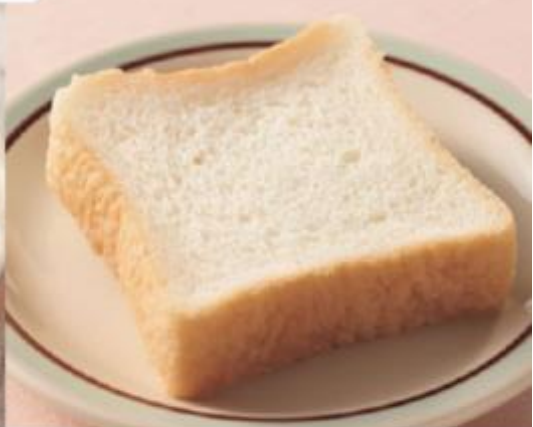
食パン 商品番号 0913 292円(税込)